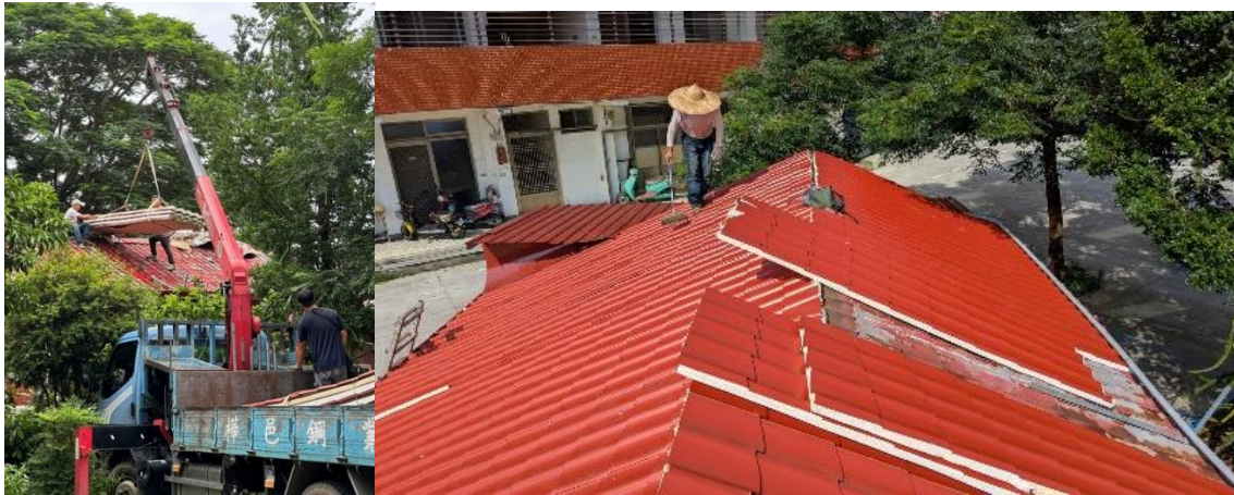
說明：更換伯特利長照巷弄站老舊的屋頂以及雨水槽