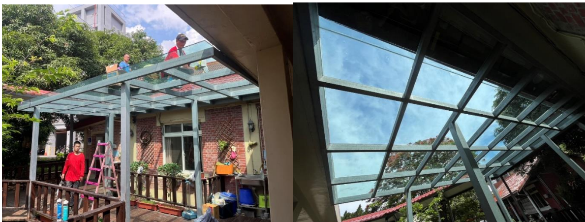
說明：更換日間照顧庭院的老舊採光罩