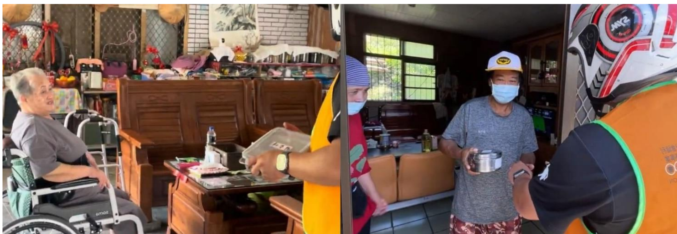
說明：在仁愛鄉送餐給長輩的志工