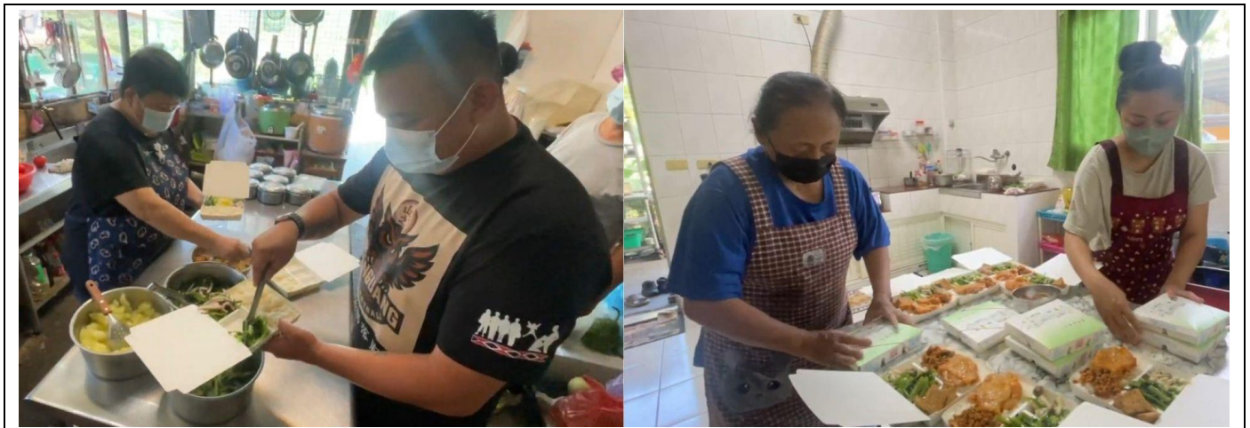
說明：在仁愛鄉的部落廚房正在為長輩準備便當