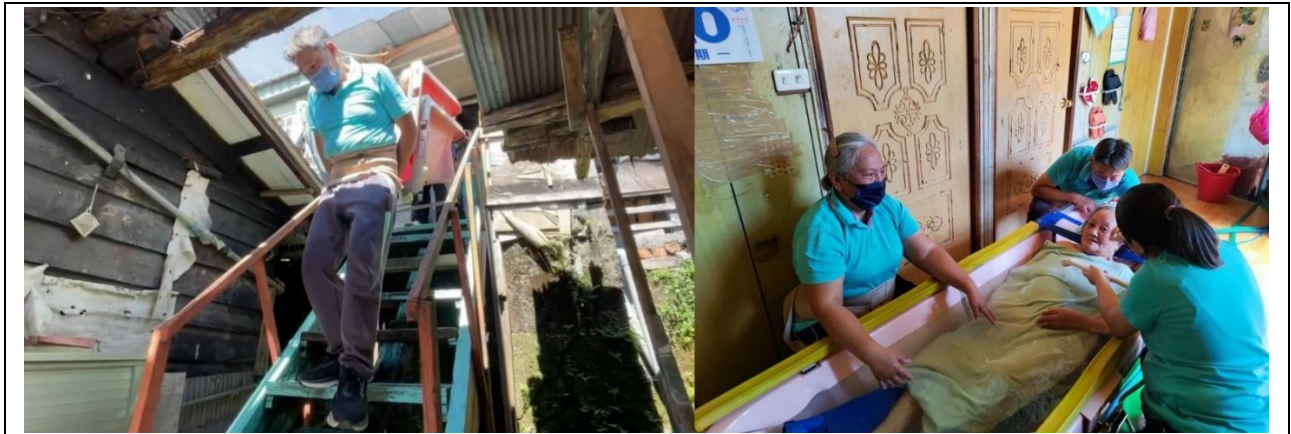
說明：因長輩居住的環境限制，居服員只能爬階梯來搬運浴缸。