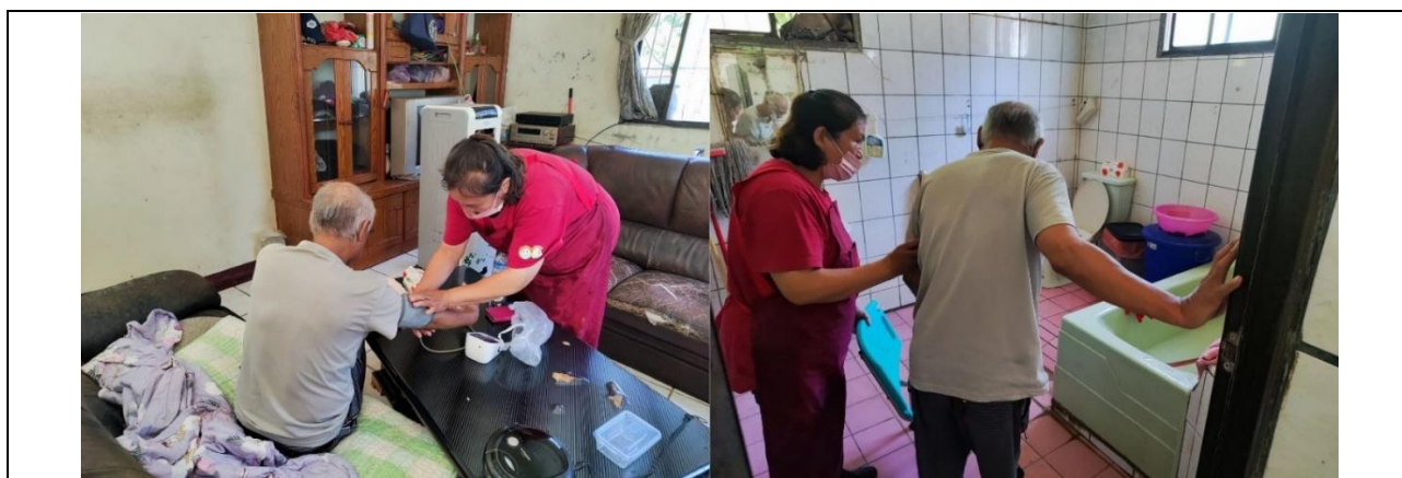
說明：居服員正在準備協助視障長輩沐浴前的量測血壓。