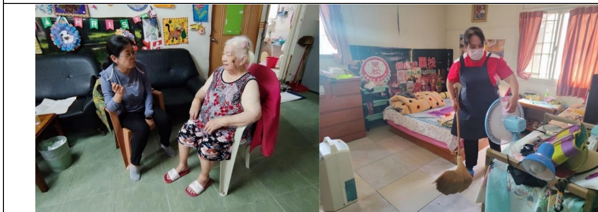
說明：居督員與長輩訪問日常狀況，而居服員正在清潔長輩的臥室。